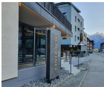
Fassaden gehören zur Produktpalette der Werner Keller Metallbau AG.

www.kellermetall.ch mail@kellermetall.ch