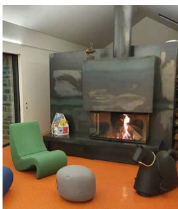
Referenz: Kundenspezifische Spezialkonstruktionen.